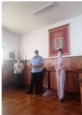
SALUD Mental La PALMA 15 de junio de 2020 · 48 Desde el 2012 nuestra entidad Salud Mental La Palma trabaja en coordinación con el equipo de S.S. del Suizo Ayuntamiento de Tazacorte. Para agradecer más por este trabajo de colaboración.

Firmando un acuerdo con Ayuntamiento de Tazacorte