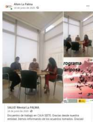
SALUD Mental La PALMA 15 de junio de 2020 · 48 Encuentro de trabajo en CAJA SEITE. Gracias desde nuestra entidad. iremos informando de los acuerdos tomados. Gracias!